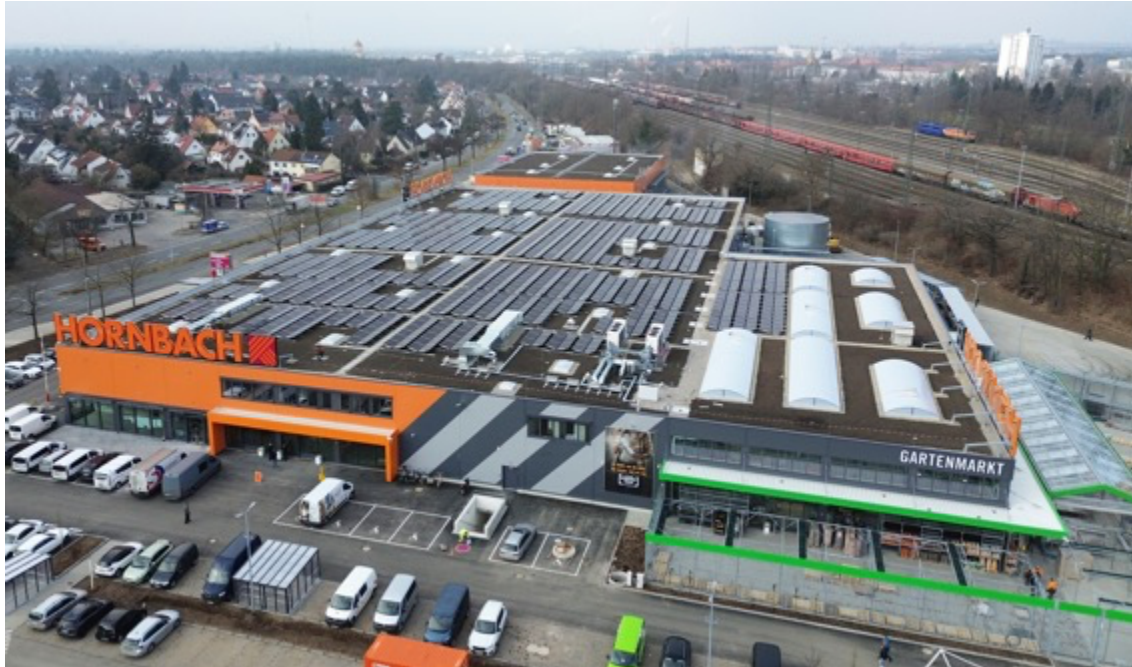
HORNBAACH legt beim Neubau des Marktes Wert auf eine ressourcenschonende Bauweise und hochmoderne Haustechnik

Nürnberg, 07. Februar 2025. Am 26. Februar 2025 um 7 Uhr öffnet der neue HORNBAACH Markt in der Trierer Straße 171 in Nürnberg seine Türen. Derzeit läuft die Einrichtungsphase auf Hochtouren.