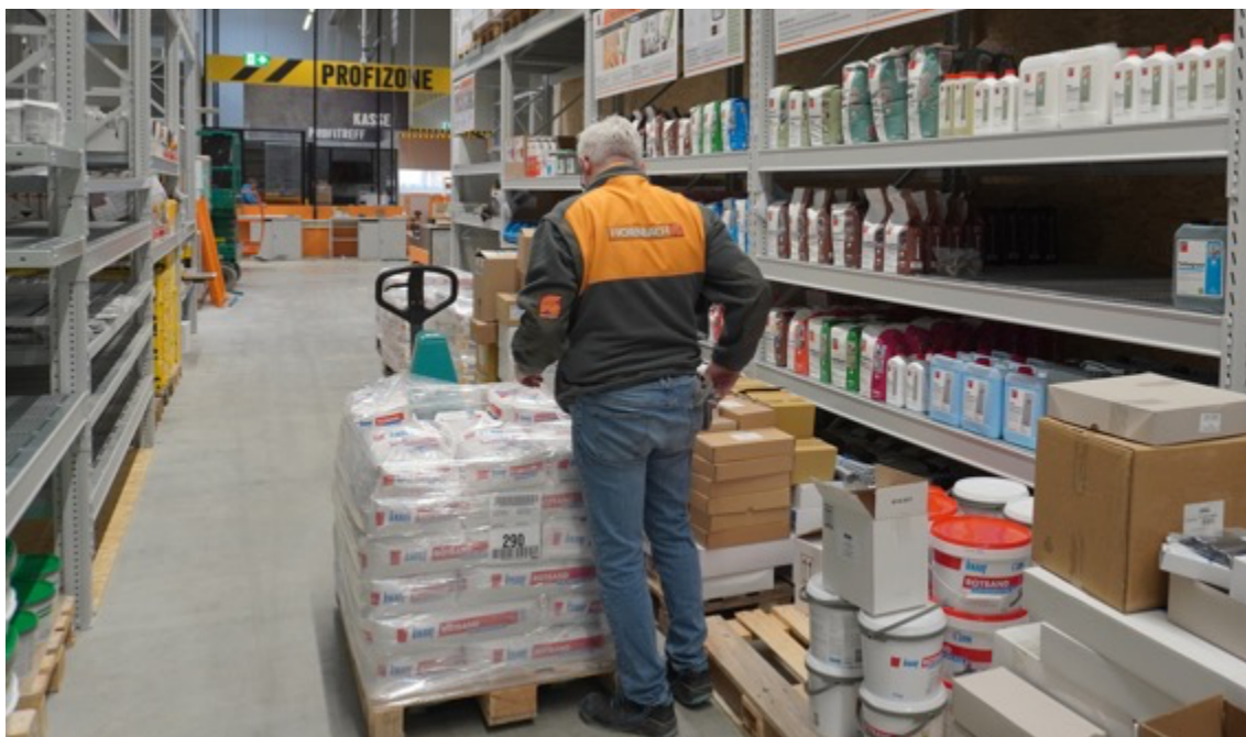
80 Mitarbeitende stehen den Kundinnen und Kunden künftig mit Rat und Tat zur Seite. Darunter 20 neue Mitarbeiter. Sie wurden im Vorfeld umfassend fachlich weiterqualifiziert.

Nürnberg, 07. Februar 2025. Am 26. Februar 2025 um 7 Uhr öffnet der neue HORNBAACH Markt in der Trierer Straße 171 in Nürnberg seine Türen. Derzeit läuft die Einrichtungsphase auf Hochtouren.