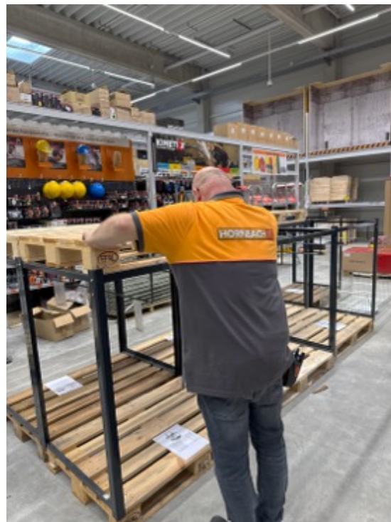
Anpacken und schön machen für die Kunden.

Über die weiteren Highlights des Marktes, darunter der lichtdurchflutete Gartenmarkt, die Möglichkeiten zur Badplanung sowie die ressourcenschonende Bauweise informiert HORN BACH im Rahmen eines Pressegesprächs am 25. Februar 2025, um 11 Uhr vor Ort im Markt in der Trierer Straße. Alle Medienvertreterinnen und -vertreter sind sehr herzlich eingeladen. Bitte melden Sie sich per E-Mail an: public.relations@hornbach.com