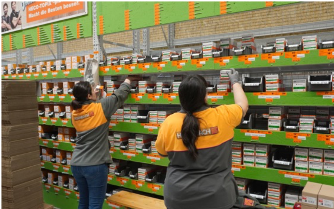
Bei der umfangreichen Auswahl an Schrauben, die HORN BACH bietet, kommt es auf die Details an.