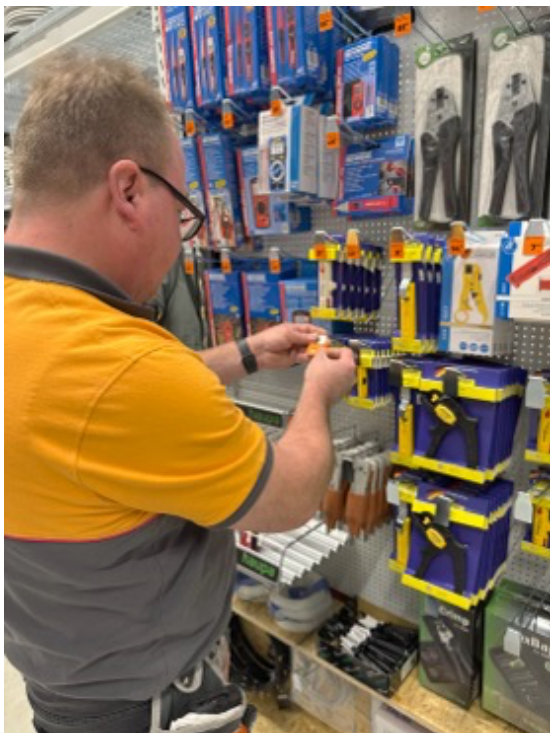
Alle Produkte müssen genau ausgeschildert werden.